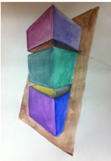
6. Прибавление и вычитание объема. Рисунок композиции из кубов в холодном колорите.