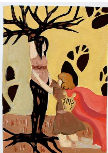
Цвиткис Дина Иллюстрации к мифам Древней Греции/уащ.