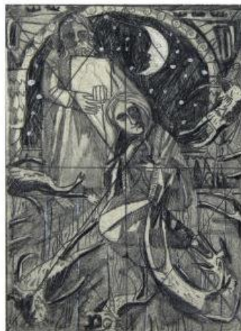
15 x 10,5