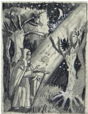
12,5 x 9,3