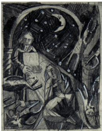
12,4 x 9,5