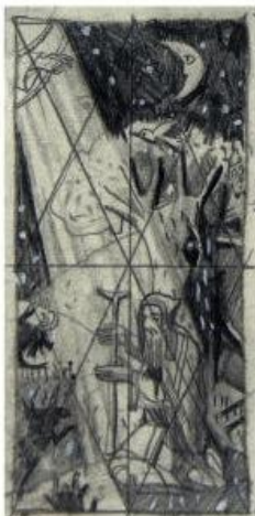
14,3 x 6,8