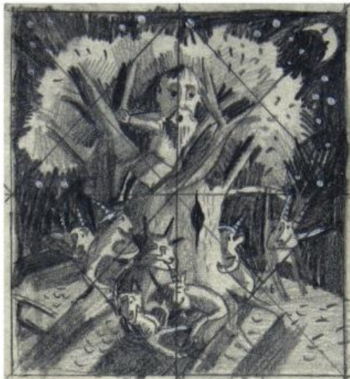
11,5 x 11